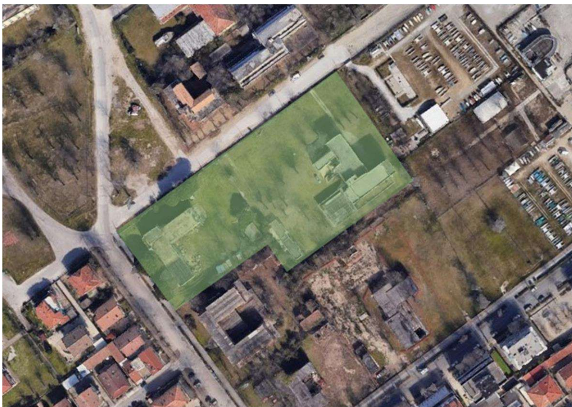
Foto aerea urbana oggetto di rigenerazione