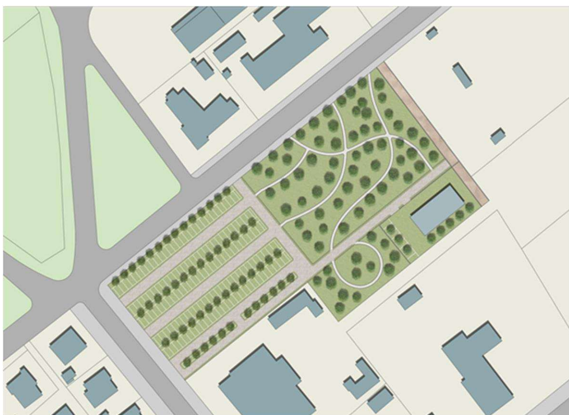
Ipotesi di fattibilità progetto area urbana